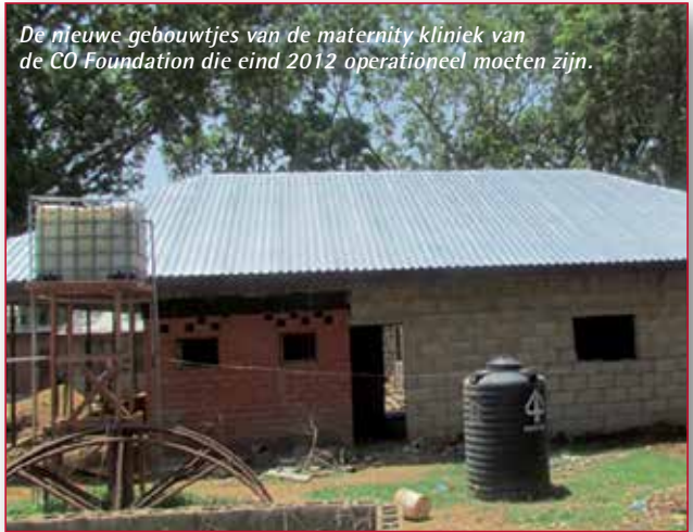
De nieuwe gebouwtjes van de maternity kliniek van de CO Foundation die eind 2012 operationeel moeten zijn.

Dit belangrijke project loopt dus ondanks het vertrek van Bart en Emmy gewoon door.