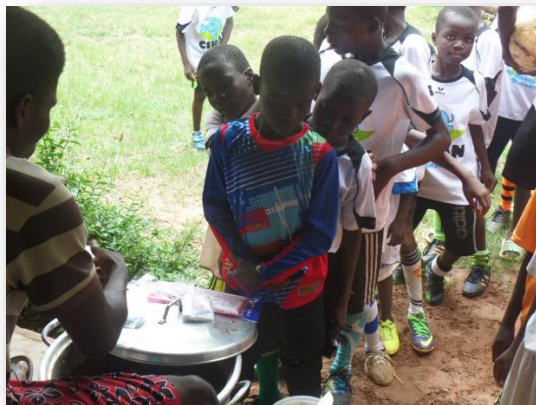
Voetballertjes in de rij voor een gratis maaltijd na de training

Drie keer per dag wordt door de jongeren zelf een gezonde maaltijd bereid met voedingsmiddelen die eenmaal per week grootschalig op markt worden ingekocht. Belangrijk is de beschikbaarheid van schoon drinkwater. Vanwege het slechte watervoorzieningssysteem in Ghana betekent dit het kopen van drinkwater. Gelukkig is schoon drinkwater niet te duur, maar toch liggen de kosten voor het water op ongeveer 200 euro per maand. We zijn bezig het water uit het boorgat middels een filter drinkbaar te maken om de last van het kopen van drinkwater te verminderen. Afgezien van het voeden van de jongeren in de kamers worden op ad hoc basis ook maaltijden geregeld voor grote groepen jongeren die niet in de gehuurde kamers wonen. Het afgelopen jaar is financiering gevonden voor de aankoop van een groot stuk grond waar de jongeren zelf groenten en fruit gaan verbouwen. De bedoeling is dat met de opbrengst daarvan voor een deel de maaltijden voor hen kan worden voorzien en mogelijk zelfs inkomsten kunnen worden gegenereerd. Ook de binnenkort te openen vakopleiding kan er van profiteren. Daarover meer in een volgend hoofdstuk.