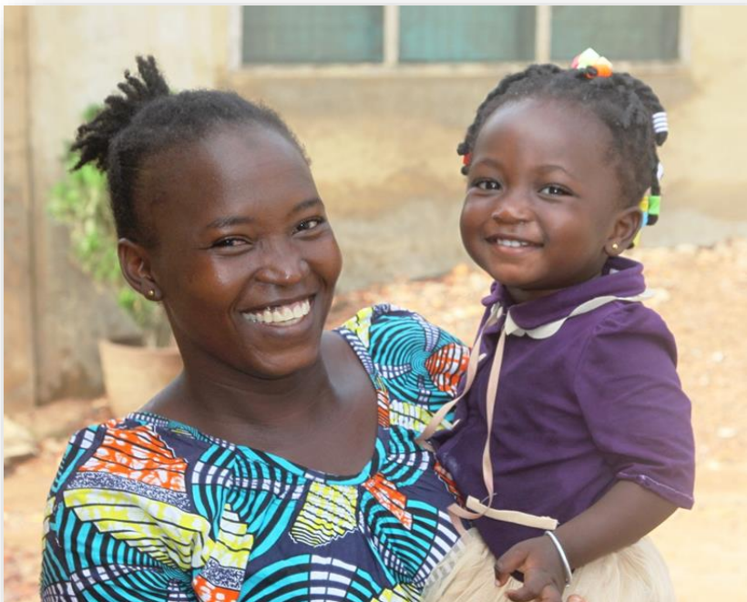
De vrouw van een van onze coaches met hun jongste dochtertje

In de volgende hoofdstukken zullen bovenstaande activiteiten van het JOP nader worden belicht.