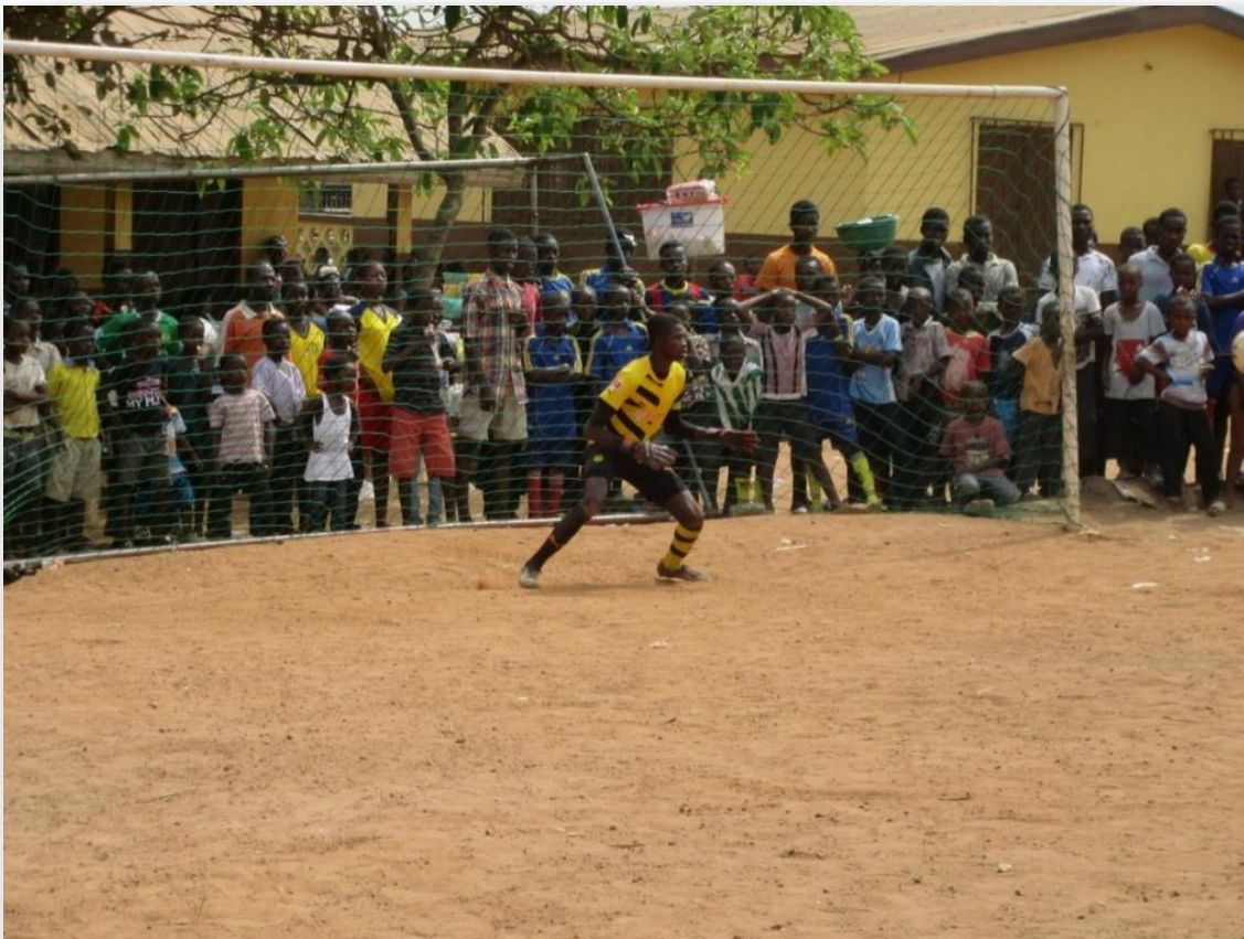
Het hele dorp loopt uit bij een thuiswedstrijd van de Kitase Action Boys FC

Bovendien raken de spelers er ook van overtuigd dat het wel degelijk uitmaakt dat je presteert op school of, als je daar te oud voor bent, je voldoende kennis vergaart in ieder geval op het gebied van lezen en schrijven en basaal rekenen. Daarover in het volgende hoofdstuk meer.