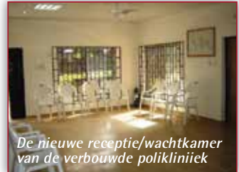
De nieuwe receptie/wachtkamer van de verbouwde polikliniek

Stichting Winters in Baarlo is al sinds het begin een zeer genereuze sponsor van de activiteiten van het polikliniekje van de CO Foundation. Mede dankzij hun ondersteuning werden in de afgelopen jaren duizenden patiënten gratis behandeld. Daarnaast doneerden dit jaar het PMC in Grubbenvorst en enkele particulieren een substantieel bedrag waarmee een groot aantal extra patiënten bij het polikliniekje terecht konden voor hun noodzakelijke medische zorg.