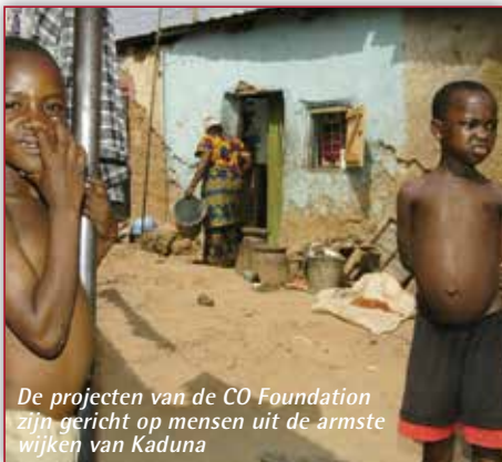
De projecten van de CO Foundation zijn gericht op mensen uit de armste wijken van Kaduna

Alle activiteiten zijn in principe zo georganiseerd dat de projecten uiteindelijk financieel zelfstandig kunnen functioneren. In de afgelopen maanden werden een aantal mijlpalen bereikt die de moeite waard zijn hier te vermelden.