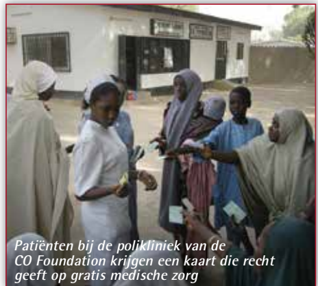
Patiënten bij de polikliniek van de CO Foundation krijgen een kaart die recht geeft op gratis medische zorg