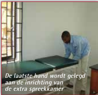
De laatste hand wordt gelegd aan de inrichting van de extra spreekkamer

In de eerste helft van dit jaar werd een donatie gedaan door het Mill Hill College uit Goirle in samenwerking met stichting de Wilde Ganzen. Er kwam geld beschikbaar om het polikliniekje uit te breiden met een extra spreekkamer, een extra behandelkamer en een groter laboratorium. De verbouwing is nu afgerond en daarmee kunnen de patiënten nog beter worden behandeld. Tot op heden kregen tienduizenden mensen gratis medische zorg en de uitstraling van de polikliniek is nu regionaal. Met name de aanwezigheid van een aantal specialisten waaronder een internist, een gynaecologe en een oogarts heeft de mogelijkheden om mensen te behandelen enorm doen toenemen.