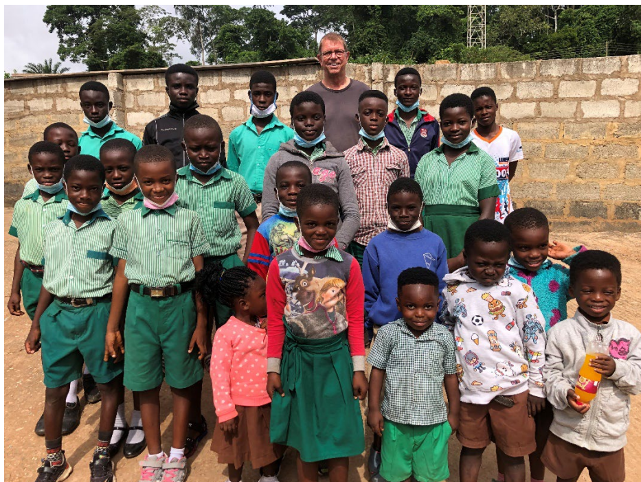
Kinderen van de Holy Child Model School die gratis naar school kunnen dankzij CO Foundation

Net toen alles in wat rustiger vaarwater leek te komen kwam in april 2020 de coronapandemie. Hierdoor moesten veel activiteiten worden uit- of bijgesteld. Toch gebeurde er veel in Kitase, het dorp in Ghana waar het overkoepelende jeugdontwikkelingsproject van de CO Foundation actief is. Vooral de samenwerking met de lokale Holy Child Model School is in deze periode geïntensiveerd. Naast het ondersteunen van de organisatie is vooral veel aandacht besteed aan het introduceren van executieve functies bij zowel leraren als leerlingen, het gebruiken van educatief verantwoord speelgoed in het oefenen van deze vaardigheden en het verder opleiden van de onderwijzers op het gebied van lesmethoden en -technieken. Daarnaast is een ruim budget beschikbaar gesteld voor het verbeteren van de infrastructuur van het schooltje.