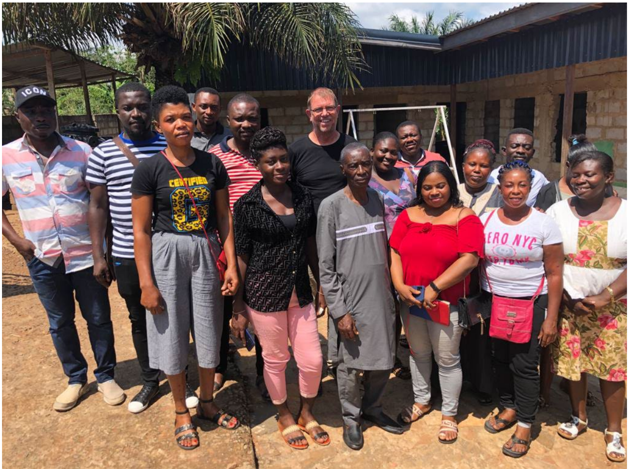
Leraren van de Holy Child Model School die allemaal een vervolg opleiding volgen.

Het afgelopen jaar hebben de activiteiten van de CO Foundation vooral in het teken gestaan van onderwijs. Het verder verbeteren van de infrastructuur van de Holy Child Model School is daar een goed voorbeeld van. Er staat nu een volledig nieuw schoolgebouw met ruime klaslokalen. Eigenlijk is het project bijna klaar, behalve de afwerking met plamuur, elektriciteit en ramen en deuren van de als laatste opgeleverde lokalen. Het is de hoop en verwachting hier samen met stichting Wilde Ganzen in 2022 voldoende budget voor te genereren.